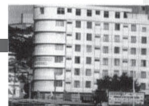
Jacaré Praia Hotel