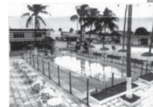
Praia das Dunas