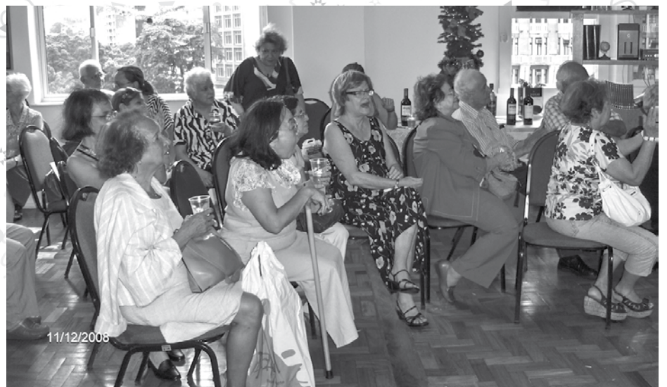
A emoção dos presentes na apresentação de Milorde