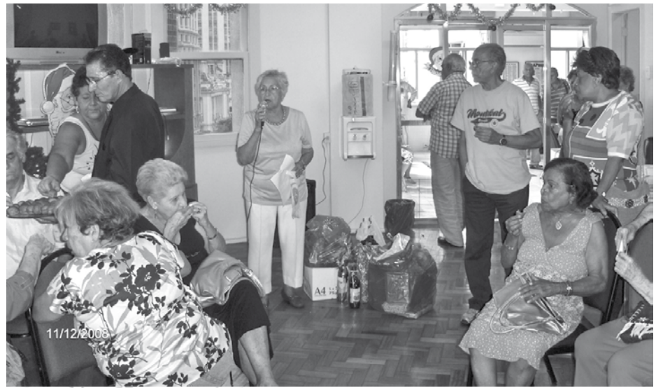
Troca de Presentes do Amigo Oculto