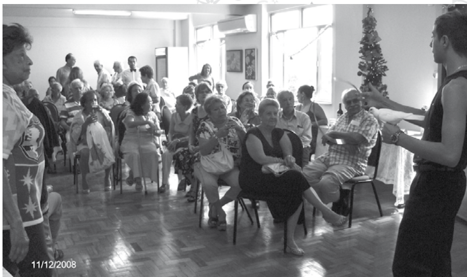
Apresentação do mágico

O DAP entrará, apenas, com a estrutura básica: conforto, segurança, banheiros, água gelada, cafezinho. Lanches, bebidas e refrigerantes ficarão por conta de cada um. Para participar, será necessário incluir o nome, pessoalmente, ou por telefone, na lista, até o dia de nossa Assembléia, essa é uma exigência do condomínio e não poderá ser contornado. Sem o nome na lista, com antecedência, será impossível o acesso ao prédio. Junte-se a nós! Venha para nosso Bloco.