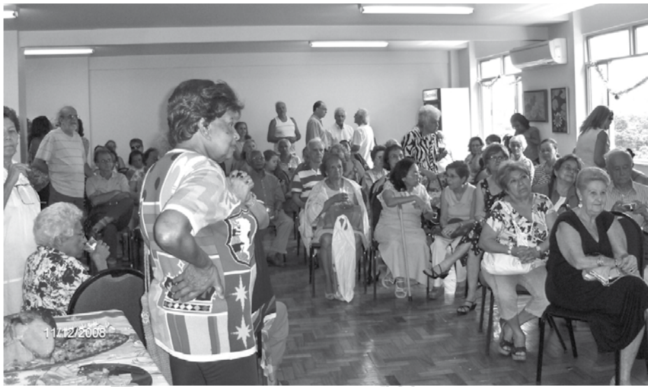
Reencontro de velhos amigos